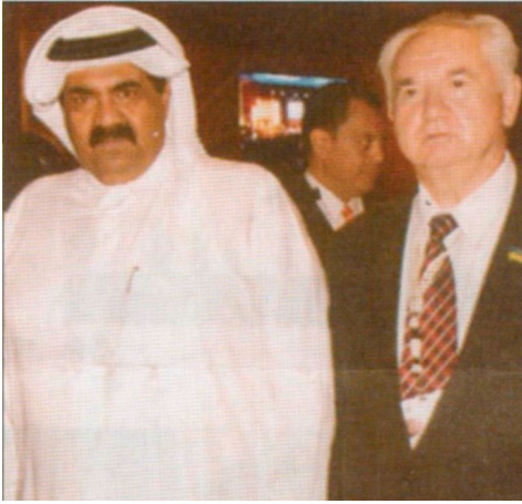
Зустріч глави делегації України, голови Комітету у закордонних справах Верховної Ради України О. Г. Білоруса з еміром Катару під час Міжнародної конференції з глобальної фінансової кризи (Доха, 2009 р.)

Олег Григорович обраний академіком Міжнародної кадрової академії (2008 р.), академіком-засновником і віце-президентом Державної академії екологічних наук України (2009 р.), почесним доктором наук Київського національного економічного університету імені Вадима Гетьмана (2009 р.), академіком Національної академії наук України за спеціальністю “Світова економіка” (2012 р.), почесним директором Інституту світової економіки і міжнародних відносин НАН України (2013 р.).