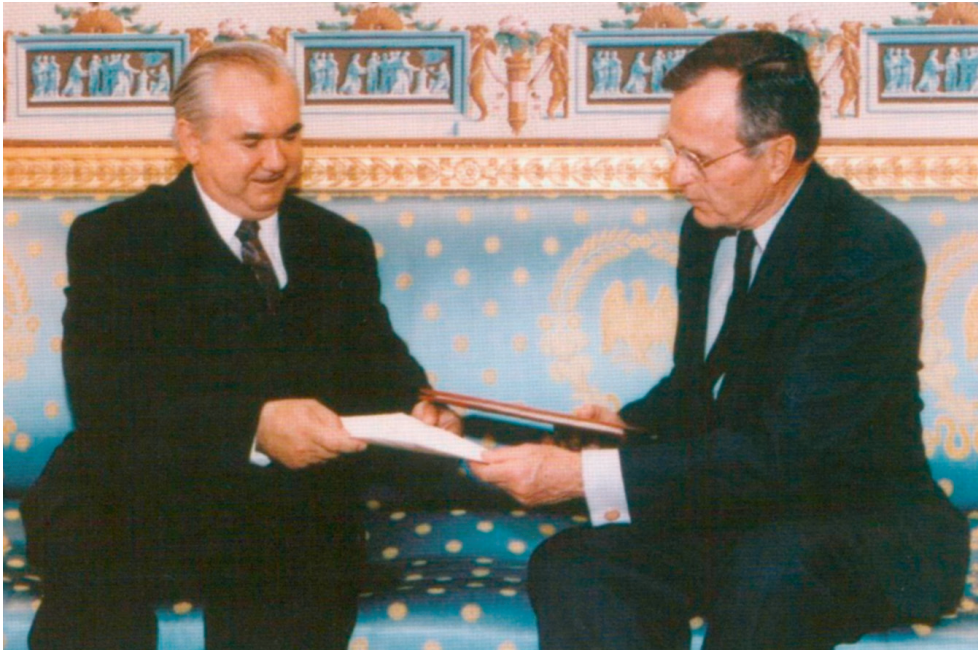
Перший посол незалежної України у США О. Г. Білорус на аудієнції у президента США Дж. Буша в Білому домі. Обговорення питань двостороннього співробітництва України та США (Вашингтон, 1992 р.)

У 1991 р. — голова Республіканського виборчого комітету на виборах першого Президента України Л. М. Кравчука.