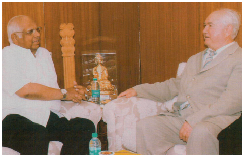
Голова Комітету у закордонних справах Верховної Ради України О. Г. Білорус веде переговори з головою парламенту Індії (Делі, 2008 р.)