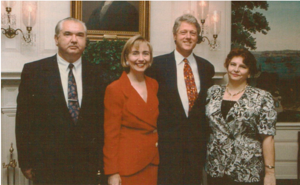
Перший посол України О. Г. Білорус із дружиною Л. І. Білорус вітають новообраного президента США Б. Клінтона та його дружину Х. Клінтон у Білому домі (Вашингтон, 1993 р.)

Після повернення в Україну, починаючи з 1995 р., О. Г. Білорус активно включився в наукову, політичну й державну роботу. Він завідувач наукового відділу глобалістики, геоекономіки і геополітики Інституту світової економіки