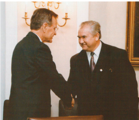
Президент США Дж. Буш і перший посол України у США О. Г. Білорус під час робочої зустрічі в Білому домі (Вашингтон, 1993 р.)

НАН України. В той час відчувалась особливо гостра потреба нової держави України у фахівцях такого калібру, патріотах-державниках, здатних захищати національні інтереси суверенної, але ще слабкої держави, яку визнав світ, але історична доля якої ще вирішена не була.