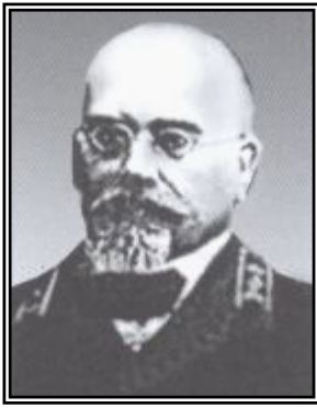
О. М. Деревицький

Листування розпочинається листом № 23 попечителя округу, що датований 21 січня 1905 р. та адресований двом особам: міністру народної освіти Володимирі Гавриловичу Глазову та ректору Імператорського Новоросійського університету Олексію Миколайовичу Деревицькому. В ньому говориться, що 20 січня 1905 р. попечитель округу одержав листа від міністра народної освіти В. Г. Глазова, в якому наголошувалося на тому, що в статтях періодичних видань, розповідях керівників учбових частин та працівників інших відомств зверталася увага на критику окремих державних розпоряджень та державного устрою імперії зі сторони як окремих викладачів, так і колегіальних органів вищих навчальних закладів. Міністр народної освіти був занепокоєний таким станом речей, оскільки замість того, щоб надати в скрутні часи для держави приклад мудрої дисциплінованості для молоді, викладачі, навпаки, "підривали" авторитет державної влади та віру в міцність державного устрою імперії. Міністр прохав попечителя вжити необхідних заходів для запобігання таких небажаних випадків.