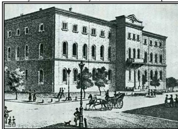
Імператорський Новоросійський університет

Аналізуючи викладацьку діяльність Р. М. Орженць-