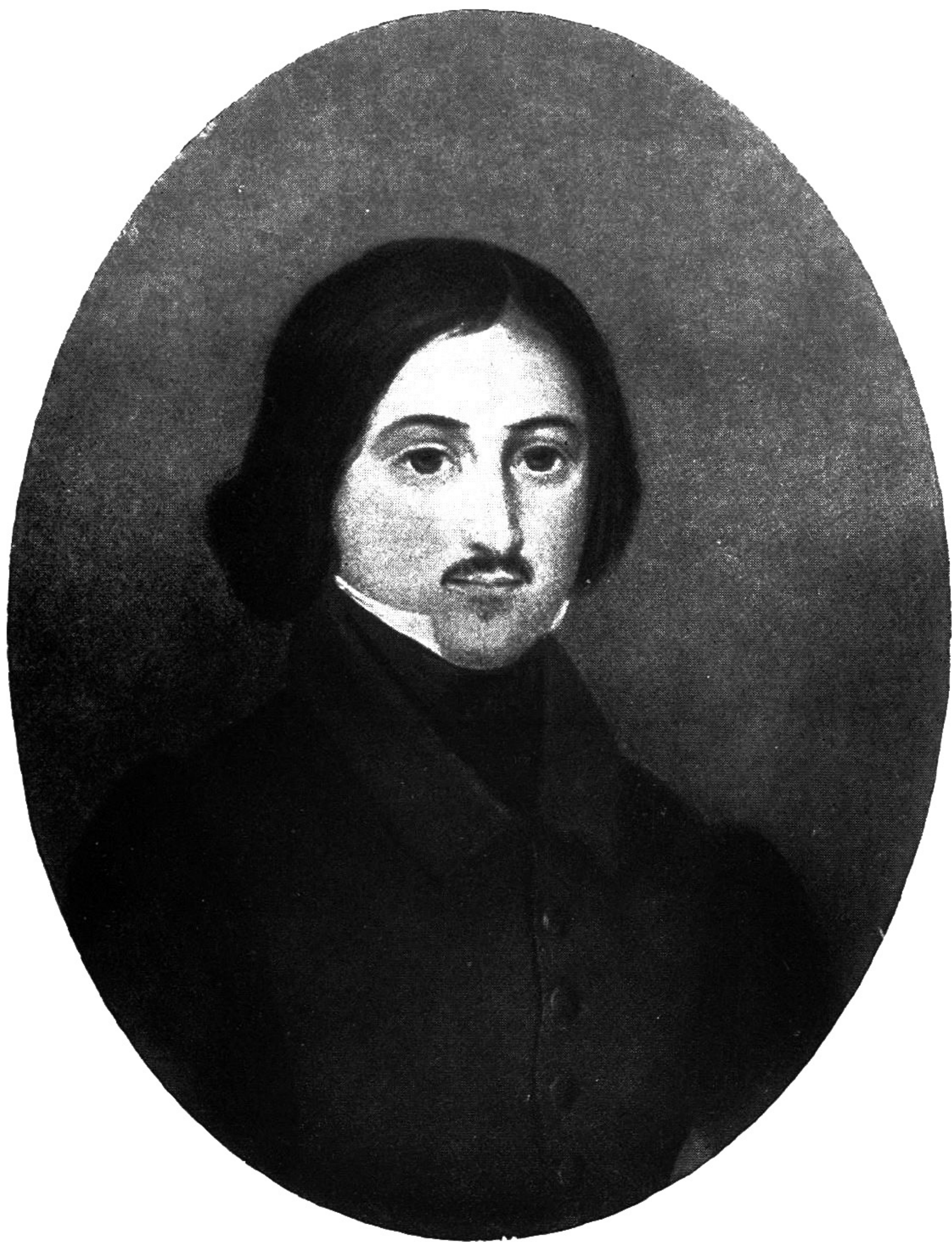
Portrét N. V. Gogola, r. 1840 (olej)