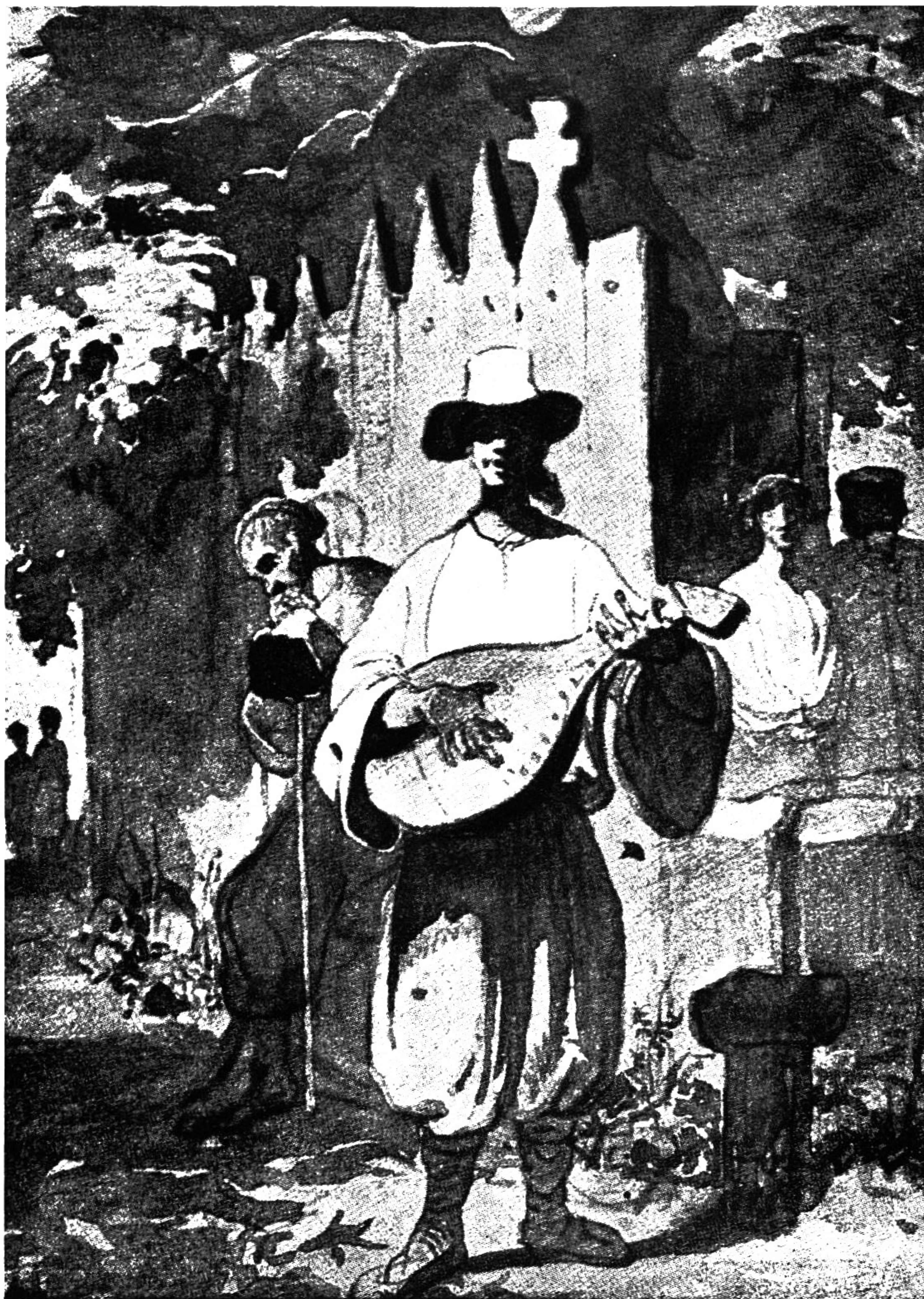
Vlastní ilustrace k básni „Nevolník“, r. 1845