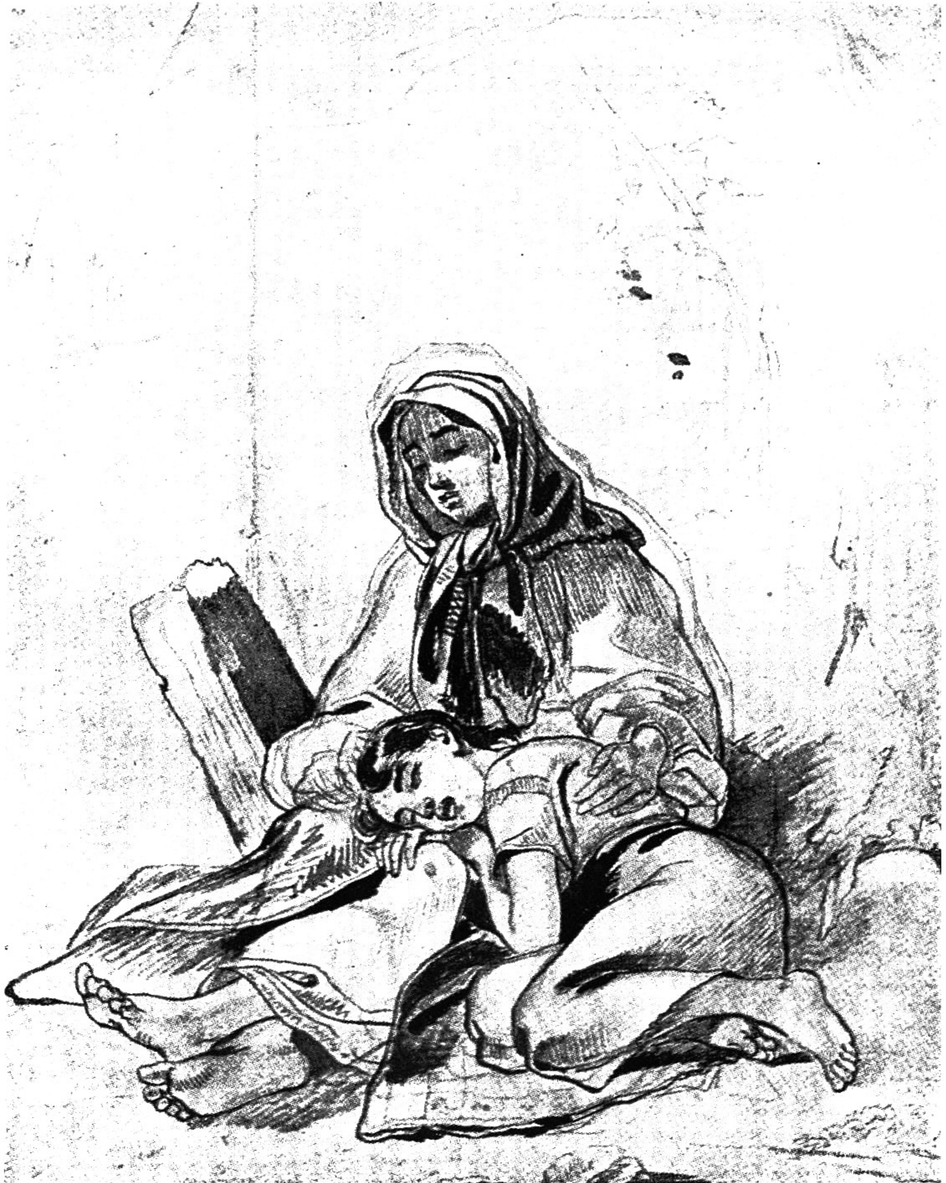
Slepá, vlastní ilustrace k epické básni „Slepá“, r. 1842