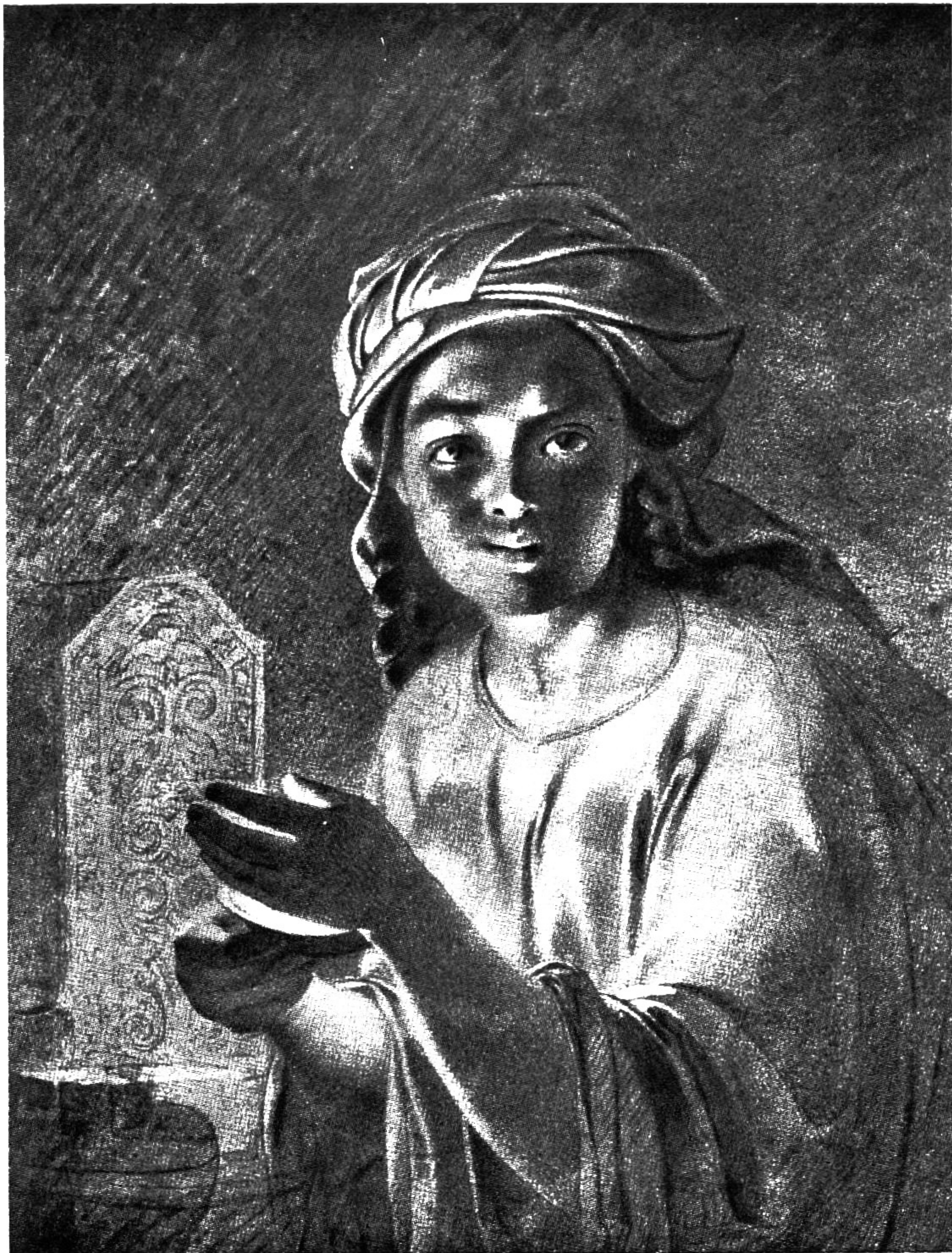
Kirgizka Káta, r. 1854—1857 (sepie)