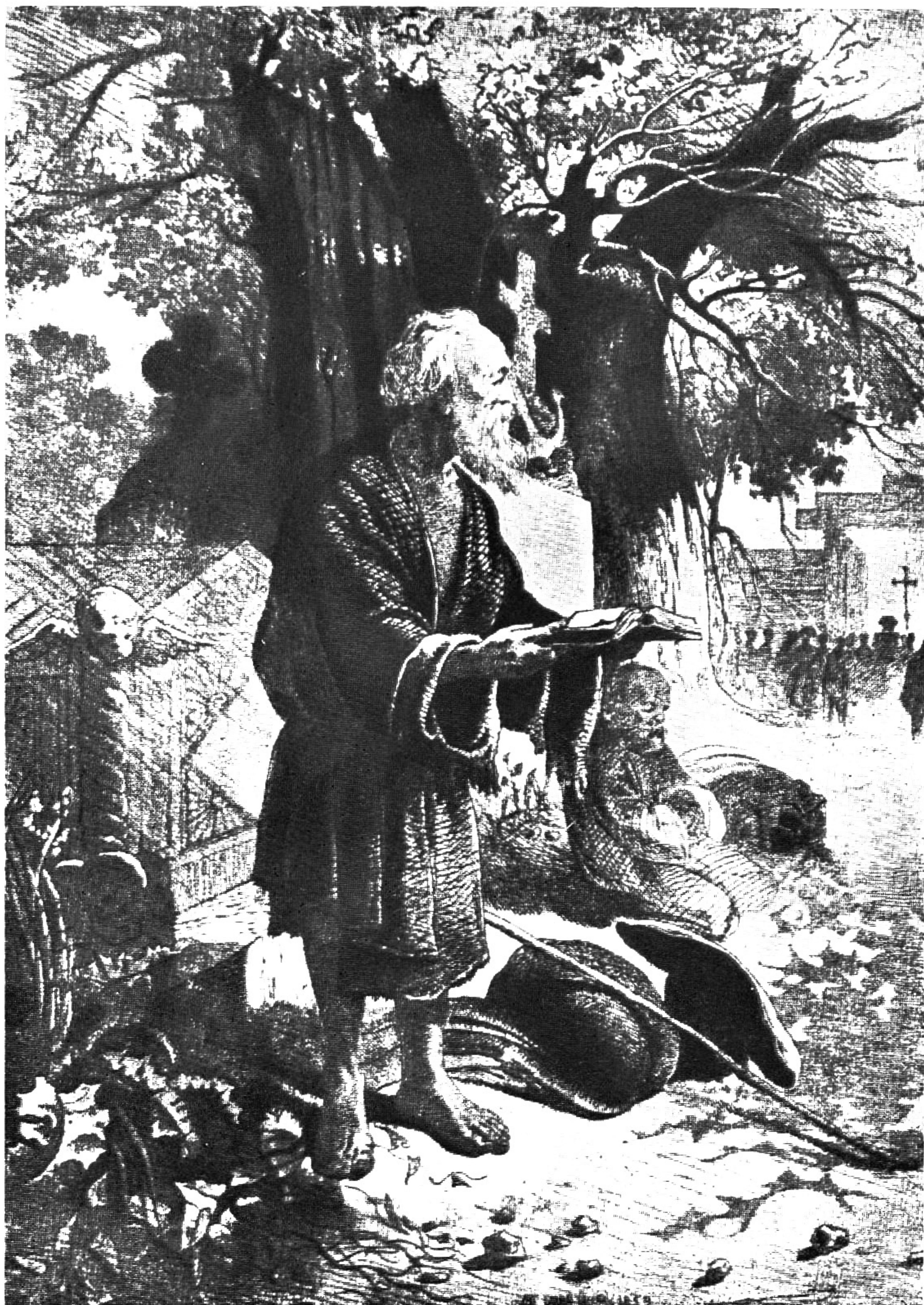
Stařec na hřbitově, r. 1859 (lept)