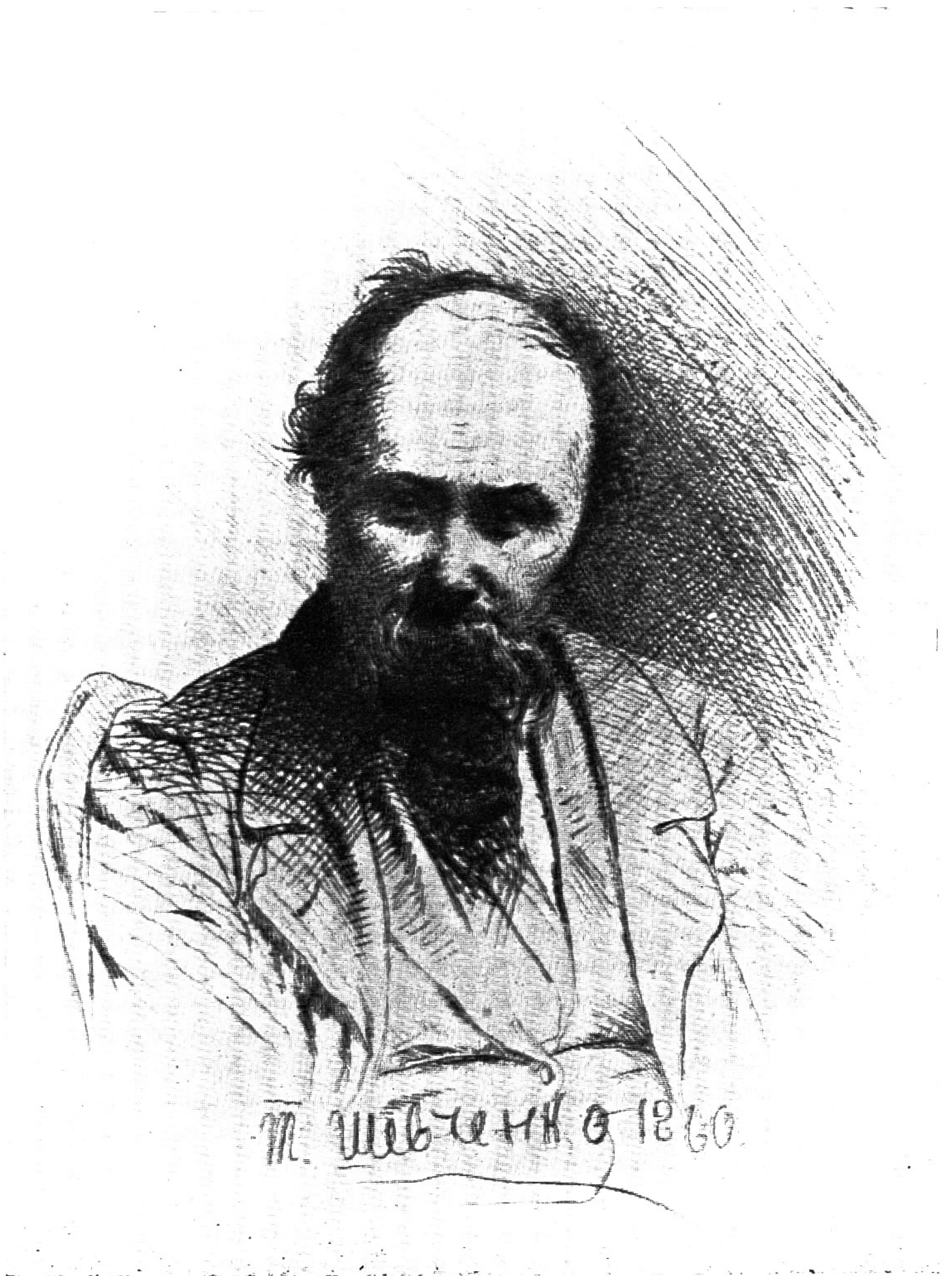
T. H. Ševčenko, vlastní podobizna, r. 1860 (lept)