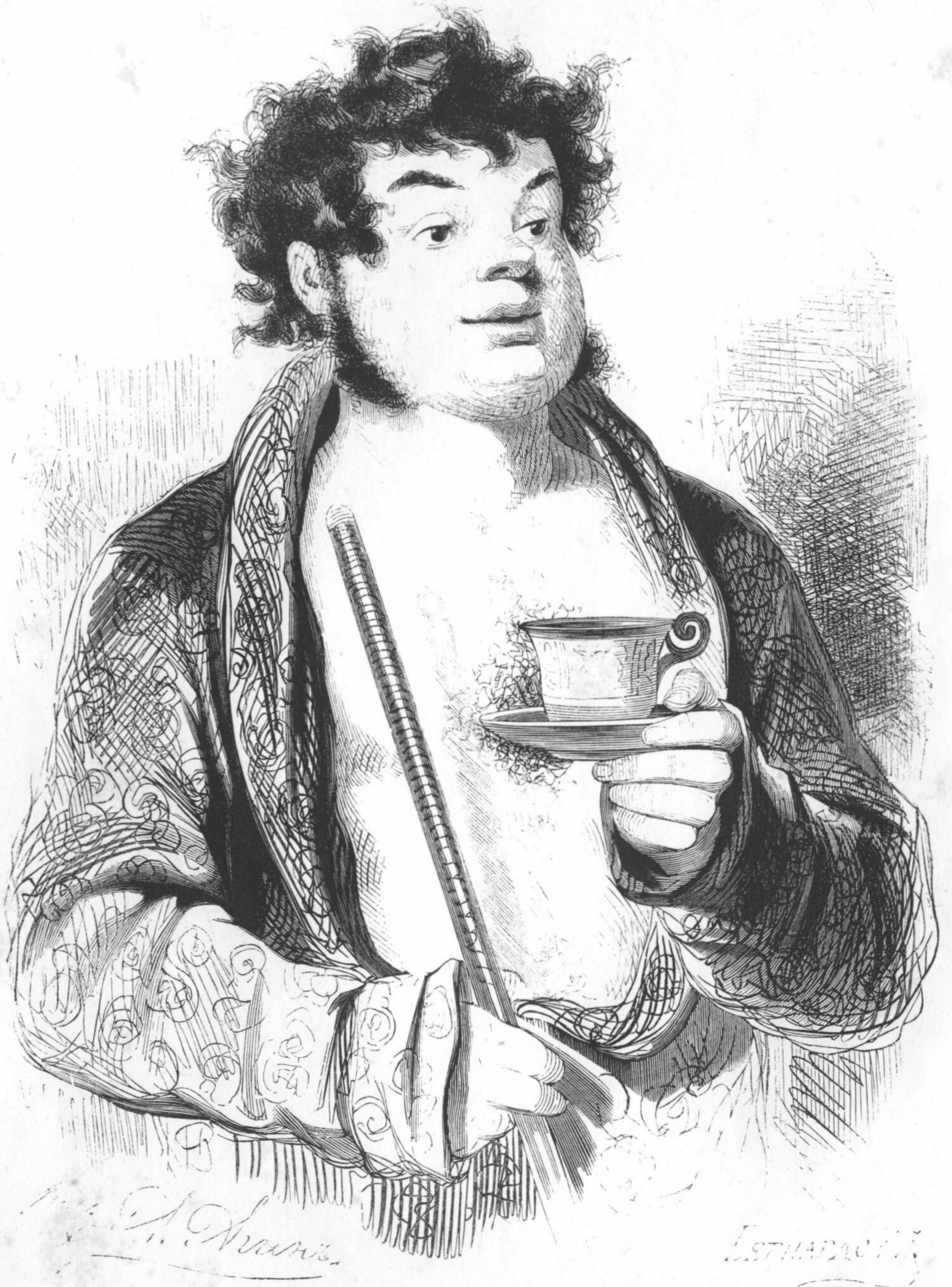
« ... Онъ былъ очень хорошъ для живописца, ... »