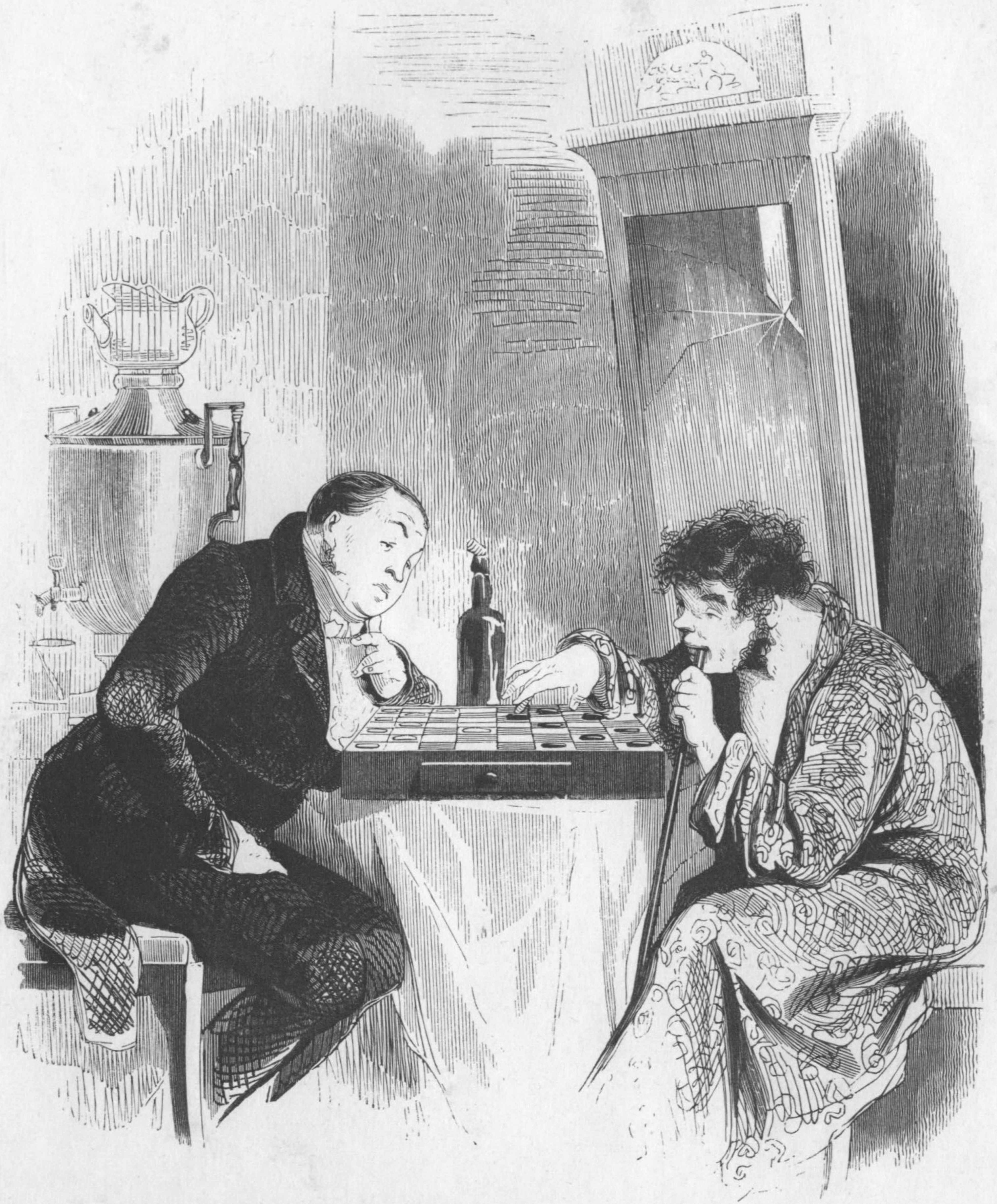
рис. В. А. Мухоморова